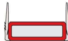
LP1504 Finesse™ (15mm x 4mm)

Se suministra con auto-adhesivo (ref.A/A)