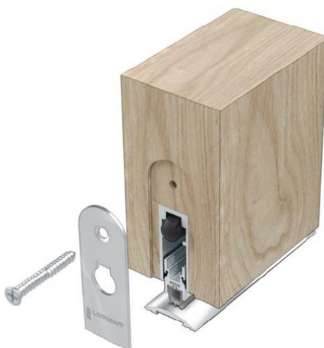
▲ LAS8001 si (shown with LAS4001)

Plata anodizado con pletinas color plata y goma de color gris. Plata anodizado con pletinas color bronce y goma de color negro.